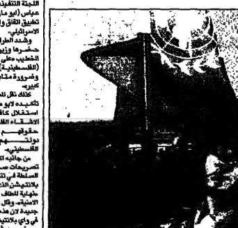
قوات حفظ سلام هندية تصل الى بيروت